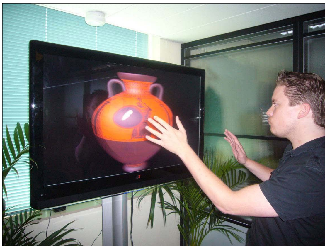
Slika: Gesture controlled Greek Amfora / Allard Pierson Museum Amsterdam

Naš intuitivni koncept prikazovanja je korak v prihodnost. Zamenjajte vaš zaslon iz pasivnega do zelo (inter)aktivnega. Enosmerna komunikacija je preteklost. Dobrodošli v svet dvosmerne komunikacije! Naj stranke resnično doživijo vaš izdelek.